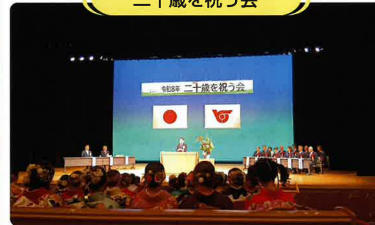
令和7年度に二十歳を迎える対象者は、男32名・女39名で合計71名でした。