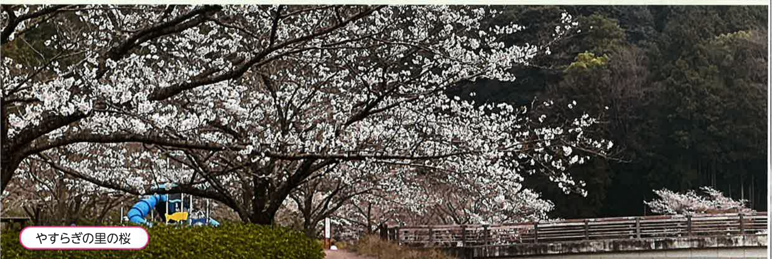
やすらぎの里の桜