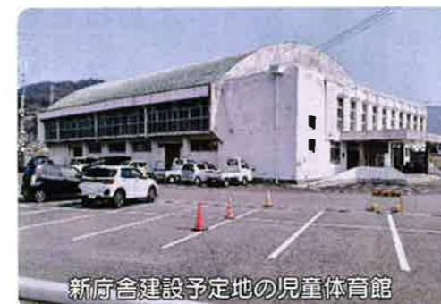
新庁舎建設予定地の児童体育館

将来的に財政シミュレーションした結果、10億円借り入れても問題点はないと考えています。 議員 固定金利は1.9%で30年間一定と説明してこられました。本当にこの条件で借りられますか。 町長 金利は3.25%一定で起債を考えています。 議員 8億円を固定金利を1.9%、30年間借りたとしてみましょう。金利の合計額は。 町長 2億8千万円となります。 議員 工業団地が出来、多くの企業進出が確実になってから建設されてはいいですか。 町長 議会も議決しています。今度の予算においても、否決するか、可決するかを協議して頂きたい。 議員 「彼件児童体育館を残して欲しい」という町民の声に対するお考えは。 町長 財政上(新しい体育館を)すぐには建設出来ない。学校の体育館を昼間は子供達に、夜は社会体育館として