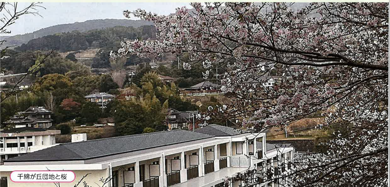
千綿が丘団地と桜