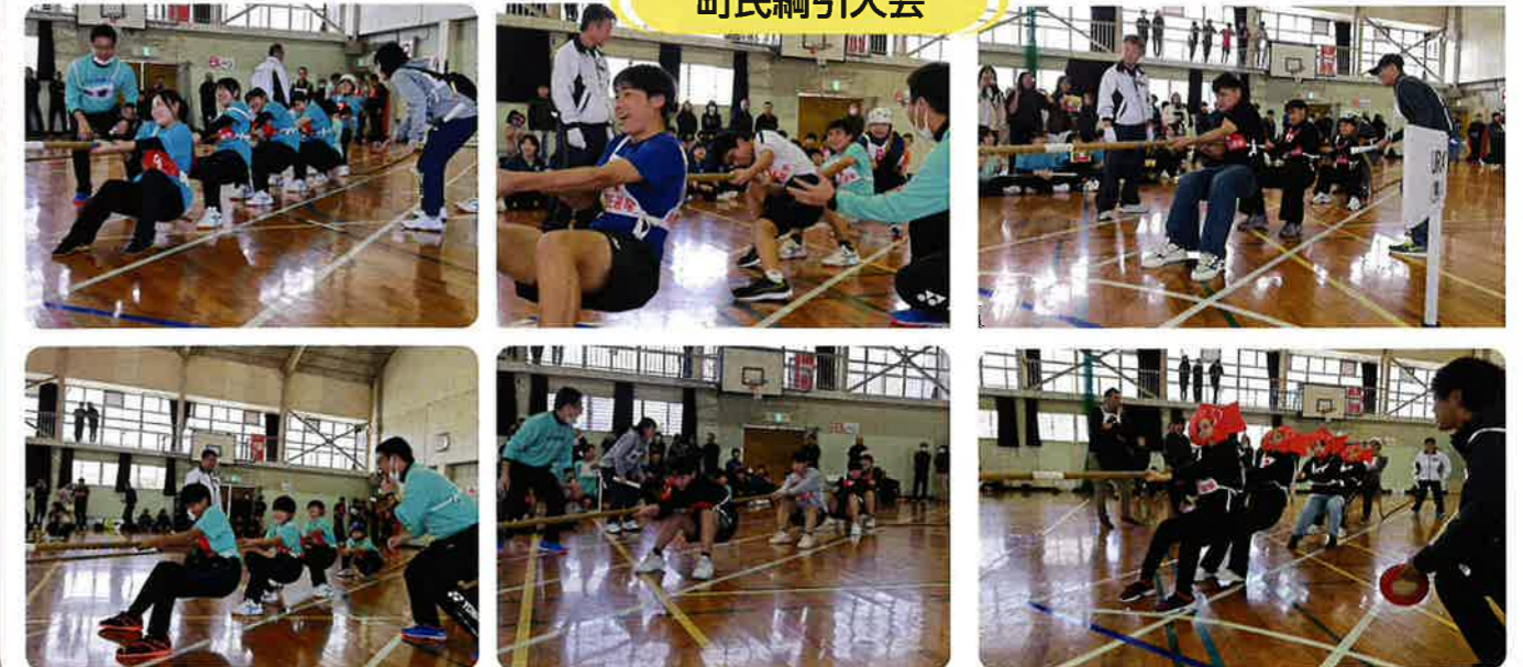
今年は中学校6チームを含む24チームが参加(近年では最多数)。白熱した戦いで盛り上がりました。