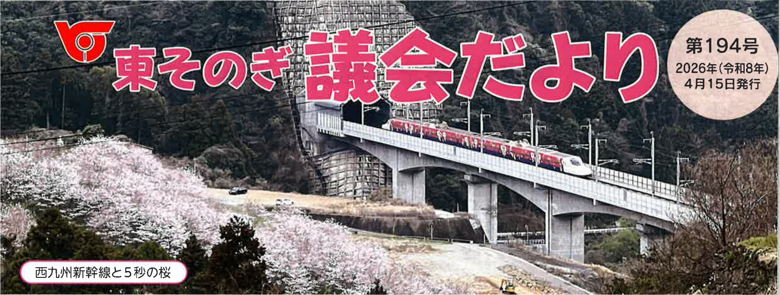
西九州新幹線と5秒の桜