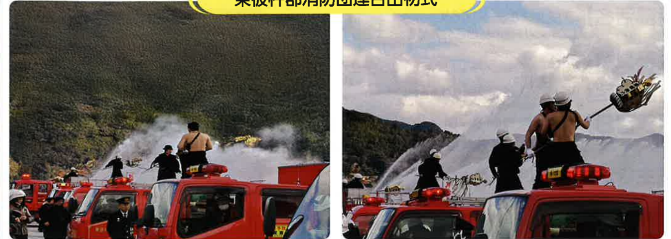
連合出初式(3町合同)は、3年に一度開催され放水演習が川棚港で行われました。