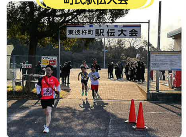
今年是一般の部10チーム、オープンの部5チームが出場し沿道から熱い声援が送られていました。