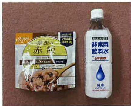
アルファーマイ 飲料水

【町長】 蔵本9号線は、地域住民の生活道路であり、建設課に対して、安全確保を優先し現場管理の徹底を指示しております。しかし、現場での陥没、亀裂等が通行に支障があれば九州電力、施工業者、建設課の3者協議にて、敷鉄板等の必要な措置を講じます。また工事期間中でも、通行等に危険が認められる場合は、必要に応じて直ちに、復旧工事や安全対策を講じます。