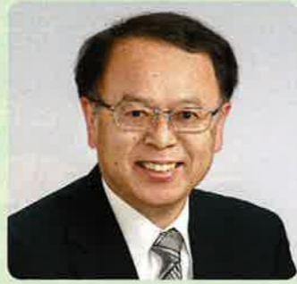
かまえ ひろみつ 構 浩光

ホームページ、インフォカナル、町公式ライン、インスタグラム、NBCデータ放送、デジタル化での情報発信している。