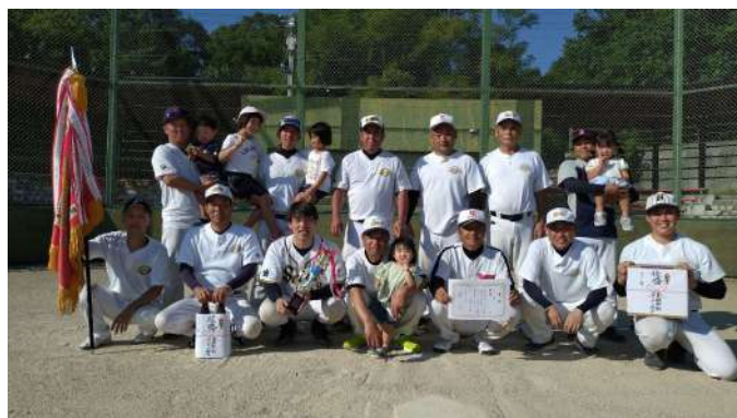
△マイナーの部優勝：法音寺地区

また、当日はまだ残暑が残る厳しい中でしたが、地区の融和と親睦を深める一日となりました。