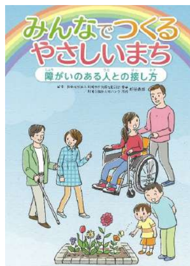
東 彼 杵 町