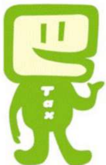
国税庁e-Taxキャラクター イータ君

有効期限を過ぎた場合、e-Tax 手続やマイナ保険証としての利用などができませんので、お早めに更新手続をお願いします。確定申告期などは窓口の混雑が予想されます。有効期限や更新手続等の詳細は、デジタル庁公式 note をご確認ください。