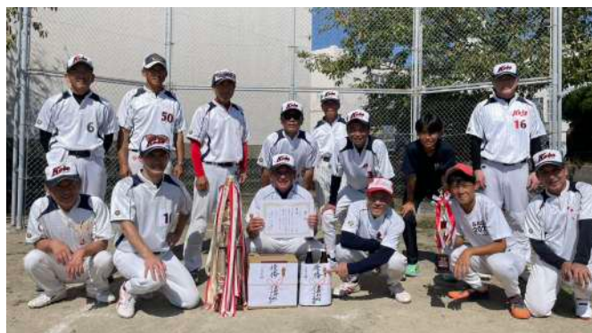
△シニアの部優勝：木場・一ツ石地区