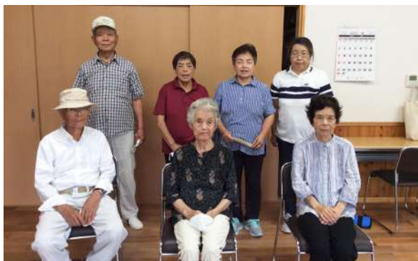
△法音寺地区いきいき百歳体操グループの皆さん