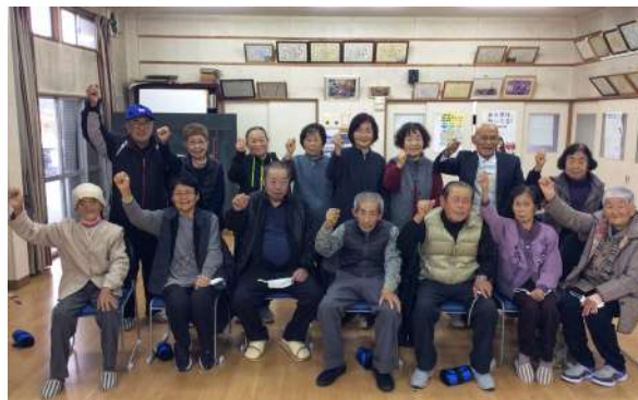
△木場地区いきいき百歳体操グループの皆さん

木場地区いきいき百歳体操 活動日時：毎週木曜日 9時から 活動場所：木場農事研修施設