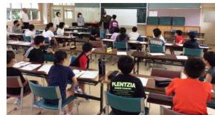
△千綿小学校での講座の様子