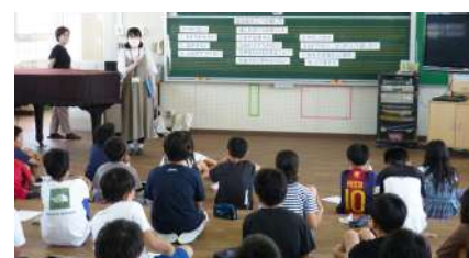
△彼杵小学校での講座の様子