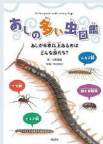
『あしの多い虫図鑑』 小野展嗣著 鈴木知之写真

昆虫ではない虫、つまり、あしが8本以上ある虫だけを100種類近く紹介する、世界初、あしの多い虫図鑑。