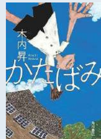
『かたばみ』 木内昇著

肩を痛め、槍投げ選手としての道を諦め、国民学校の代用教員になった梯子。恋にも破れ、ひよんなことから家庭を持ち、さらには、血の繋がらない子どもを育てる事に。