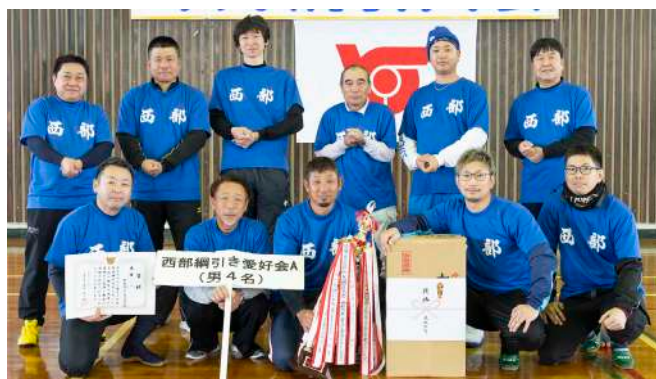
△西部綱引き愛好会