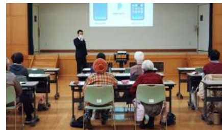
△過去に開催したスマホ体験講座の様子