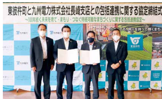
▲ 協定締結式の様子