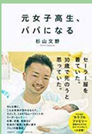
元女子高生、パパになる 杉山 文野 著

ふるさと納税に関するご質問等ありましたら、財政係までご連絡ください。 ☎ 0957-46-1205