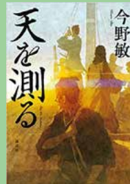
天を測る 今野 敏 著

社会が複雑化する中、「自分の普通」と「周りの普通」が噛み合わず、苦戦する人達にとっての、生きるヒントになれば、との思いも込めて出版されました。