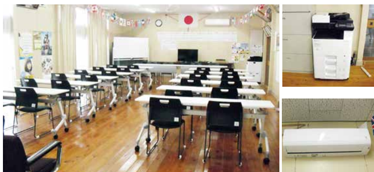
▲ 助成事業で整備した物品