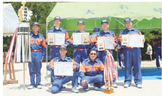
▲放水競技で優勝の第8分団