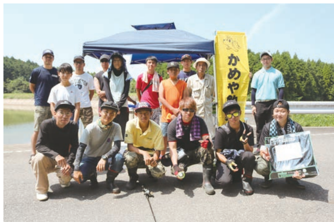
▲参加者のみなさん

町内では道の駅彼杵の荘で実施され、買い物客やドライバーに、食品の管理や手洗いのやり方など食中毒予防について呼びかけられていました。