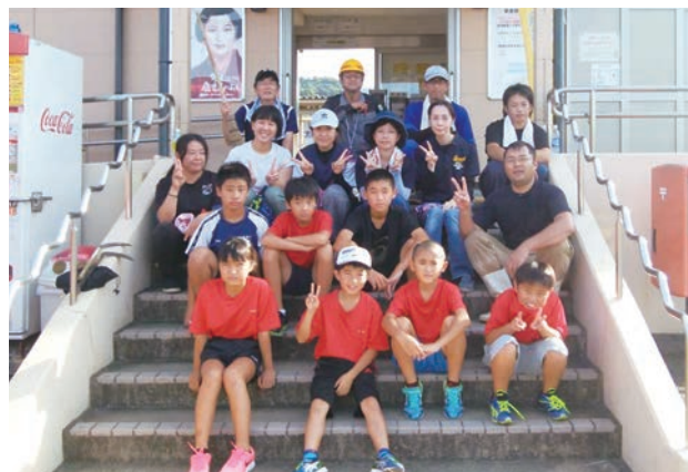
▲清掃活動を行った皆さん

作業を行っていただきました彼杵JVCの皆さん、関係者の方々、ありがとうございました。