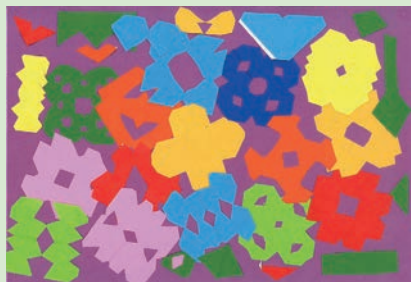
「おはながいっぱい」

僕はこの二つのことを実践し千綿小の手本になれるように頑張ります。そして、自分自身を成長させていきたいです。