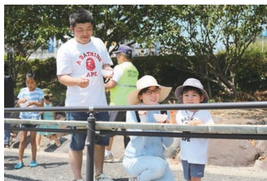
▲おなかいっぱい食べました！