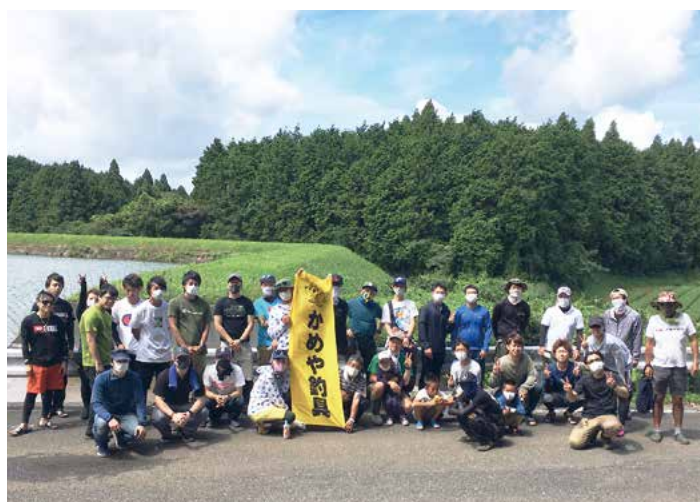
▲ ブラックバス釣り大会に参加された方々

ブラックバス釣りをできる場所がないからと毎年みなさん楽しみに参加されていて、現在バス釣りの会員は27人程度。今年は会員主催の釣り大会も計画されているようでバス釣り好きの方からは人気の釣りスポットとなっています。