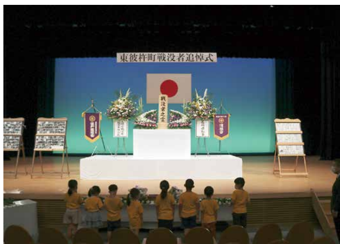
▲ 平和への祈りを捧げる子どもたち