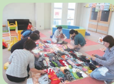
おさがり会の様子