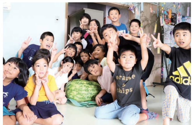
▲ 「はい！スイカ～！」のかけ声でパチリ♪