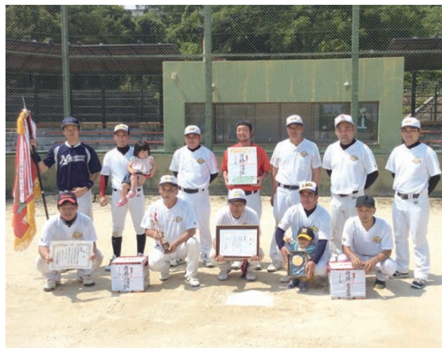
▲ マイナーの部 優勝 法音寺チーム