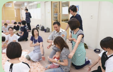
脈のとり方確認中