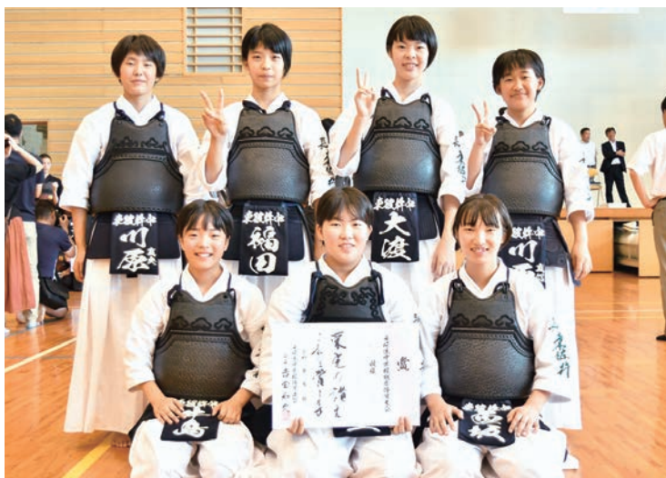
▲ 東彼杵中学校女子剣道部の皆さん

昨年までの龍は飾り用に重く、踊りには不向きでしたが、新しい龍は踊り用の龍で軽量化されたものです。来年の披露を楽しみにしています。