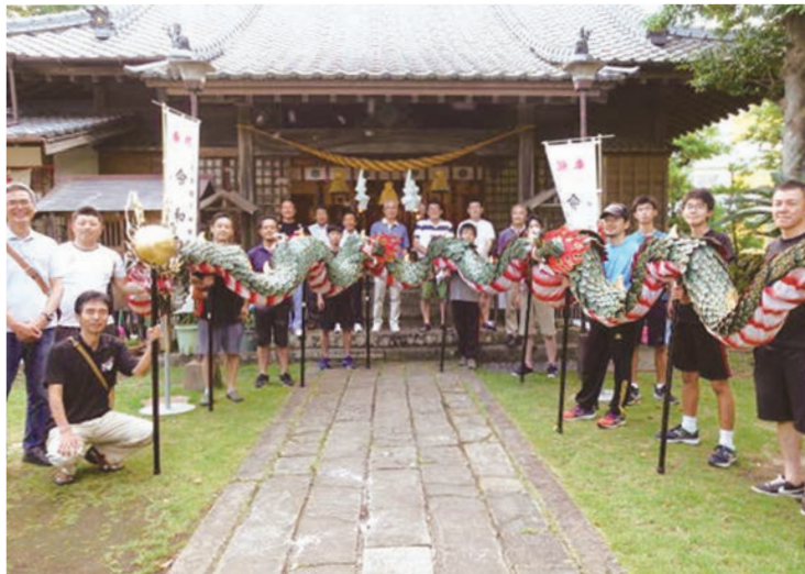
▲ 彼杵神社での奉納後に龍踊りの皆さんで