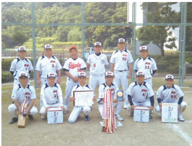
▲ シニアの部 優勝 木場・一ツ石チーム