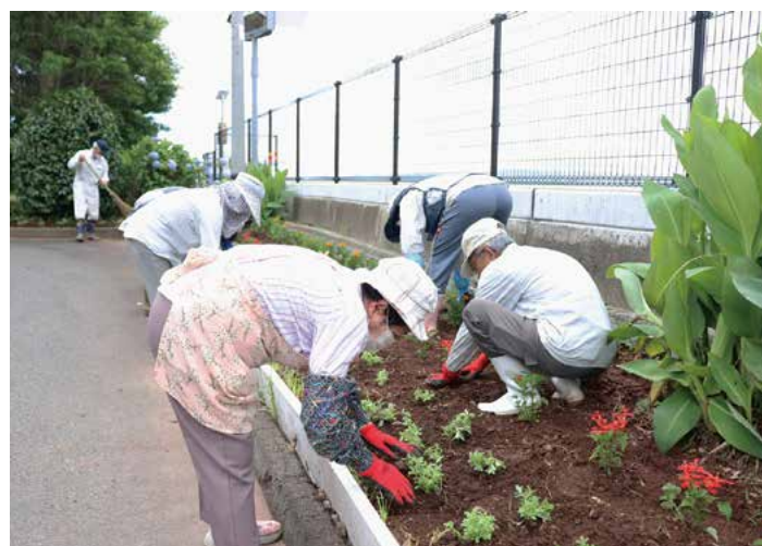
▲ 花を植えている平似田長寿会の方々

今回は新型コロナウイルス感染拡大防止の観点から、マスクの着用や時間の分散など注意しながらご協力いただきました。