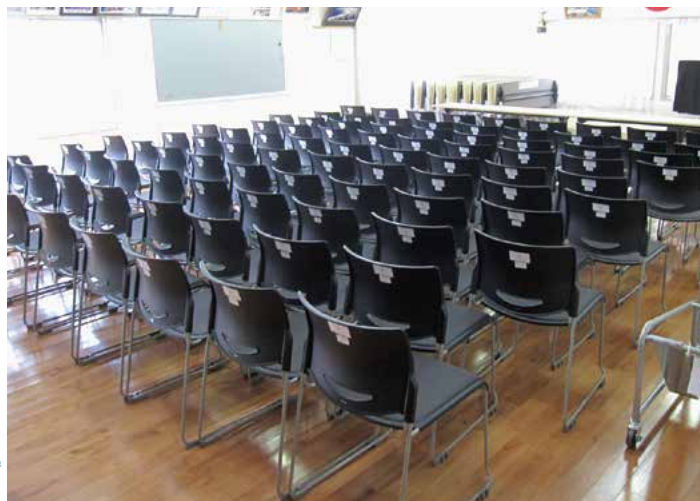
▲ 整備した机と椅子、台車