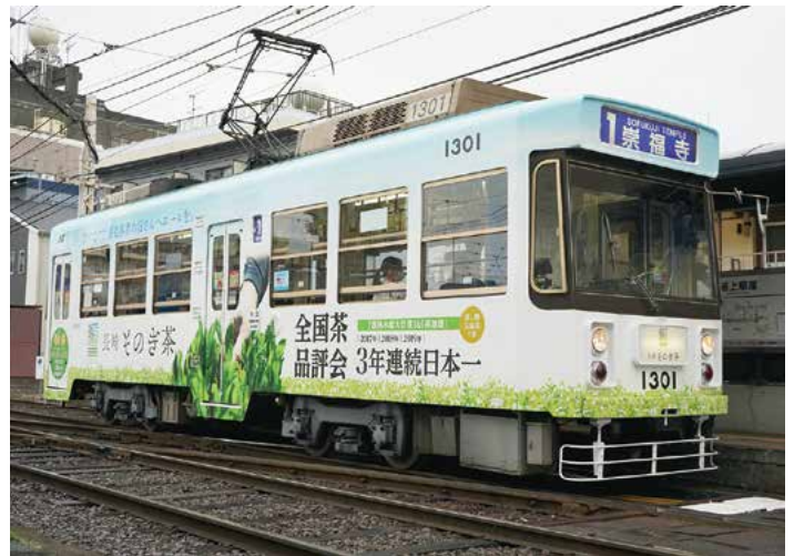
▲ ラッピングカラー電車「そのぎ茶号」