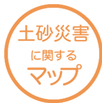
土砂災害に関するマップ