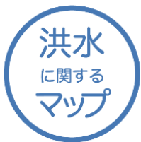
洪水に関するマップ

住所を入力すると自宅付近の洪水・土砂災害・ため池に関するマップを確認できます。また、そのマップを印刷することで「わが家の避難マップ」になります。普段から見るところに貼っておくと、危険箇所の把握や非常時持ち出し品の確認ができます。