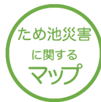
ため池災害に関するマップ

WEB版では彼杵川だけでなく、ため池の浸水想定区域や土砂災害警戒（特別）区域などが確認できます。