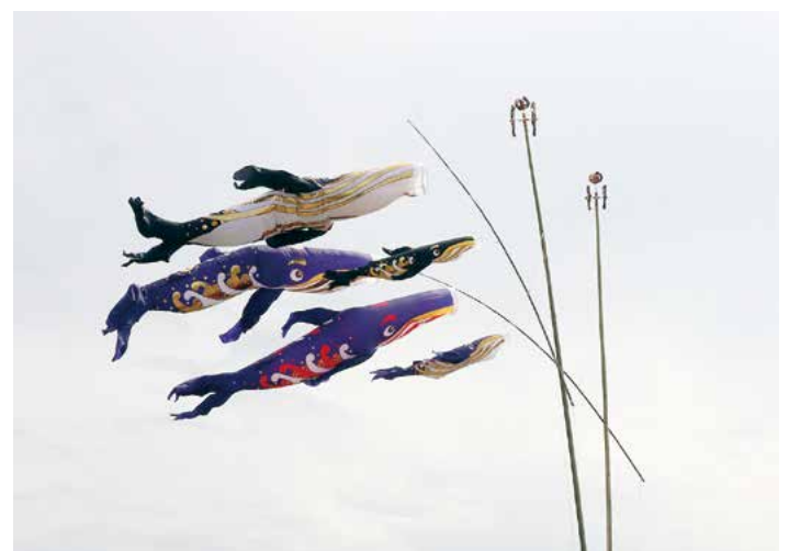
▲ 寄贈された「くじらのぼり」