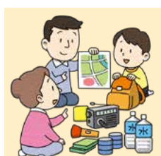
避難所や非常時 持ち出し品の情報