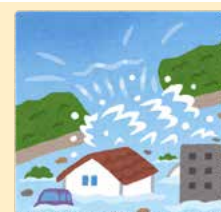
大雨がふったときに 浸水する地域は？