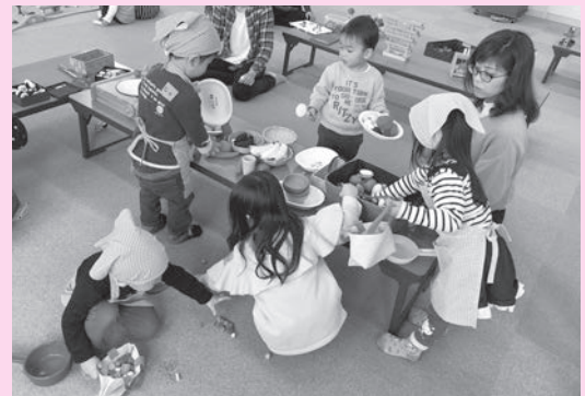
▲2/21 おもちゃ広場の様子