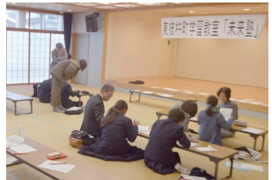
1月19日(金)の「未来塾」の様子

ぜひ一度参加してみませんか。気楽に楽しく勉強することができますよ。お待ちしております。