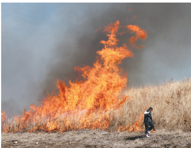
▲5メートル以上の大きな火柱が立ちました