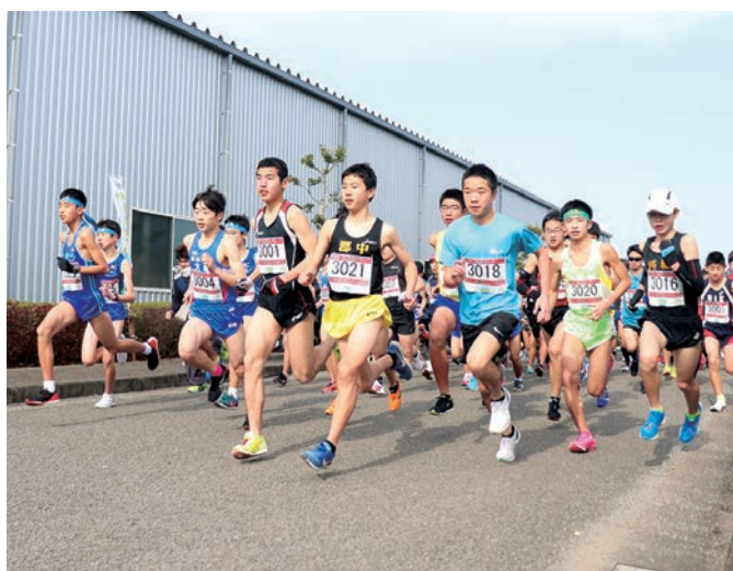
▲当日は、全ランナーが完走しました

贈呈された車両は、現在運行中で町内各地で見ることができます。皆さまの積極的な利用をお願いいたします。