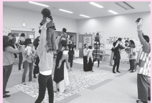
▲音楽遊び&誕生会の親子ふれあい遊び