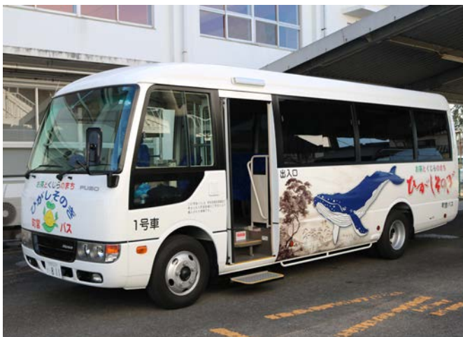
▲ご寄附いただいた町営バス