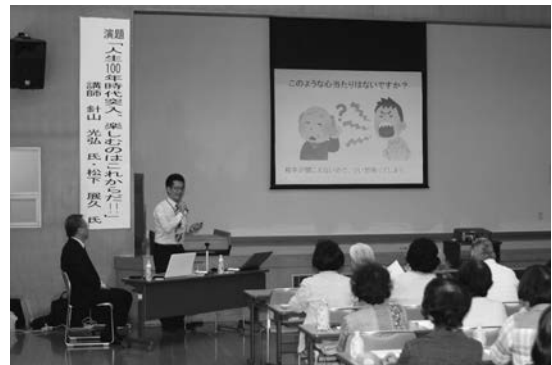
6月開催講座の様子