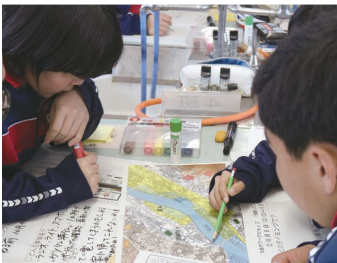
▲適切な避難経路を検討しました

会場では、婦人会による豚汁のほか、赤木、八反田、中岳自治会などからもふるまいがなされ、完走されたランナーの皆さんが長蛇の列を作りました。