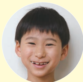
2 年 福丸 蒼 あおい 依