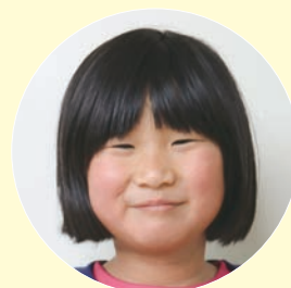
2 年 釜坂 美 みう 海