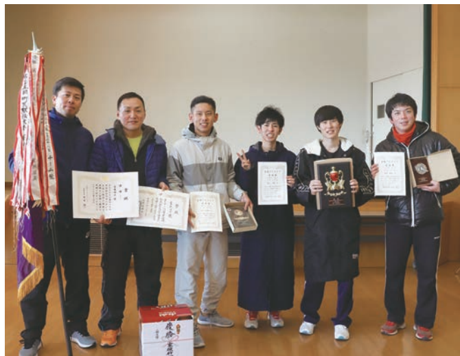
▲一般の部優勝「菅無田Aチーム」のみなさん