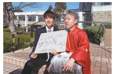
「I Love You Thank You」