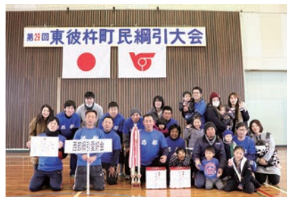
一般の部優勝：西部綱引愛好会