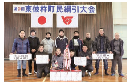
フリーの部優勝：下三根A