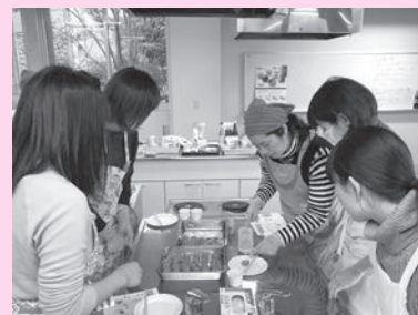
▲みそ玉つくりの様子