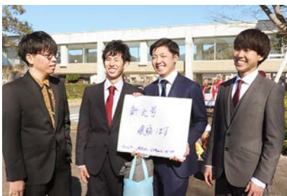
「新元号でも頑張ります」