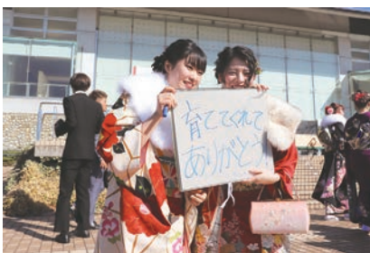
「育ててくれてありがとう」