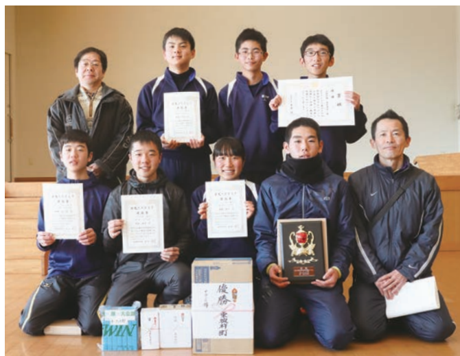
▲オープンの部優勝「合格祈願(彼杵中学)」