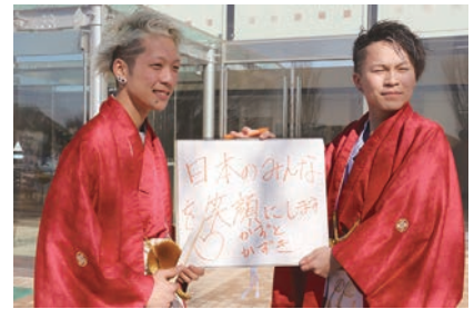
「日本のみんなを笑顔にします」