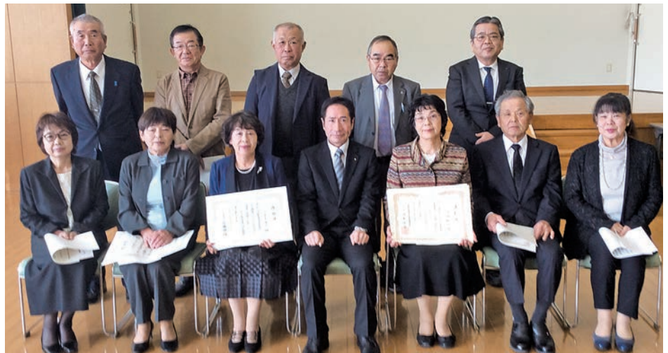
▲ 退任された 10 名の方と町長・東彼北松福祉事務所長