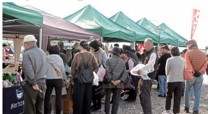
▲ そのぎ茶と野菜・いちごなど大人気！