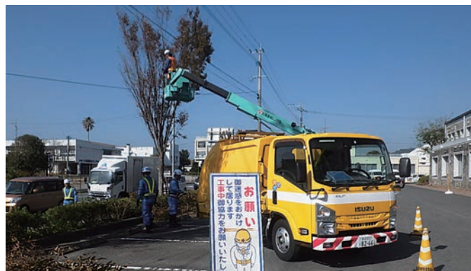
▲ 総合会館の高木剪定の様子

町内では、総合会館の高木を高所作業車を使って剪定していただきました。ボランティア作業、大変ありがとうございました。