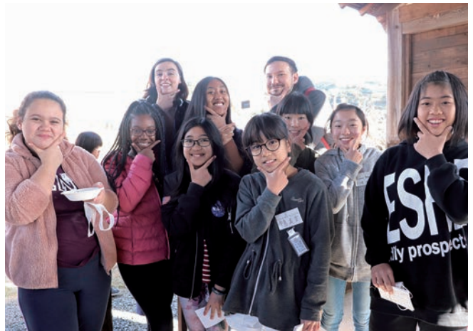
▲ 交流中の子どもたち

自己紹介カードを渡し、英語で自己紹介をした子どもたちは、「伝わった!!」と大喜び。言葉を越えた交流ができ、楽しく過ごしていました。