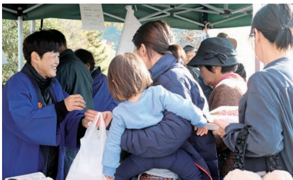
▲ 和牛販売は朝一から行列が！