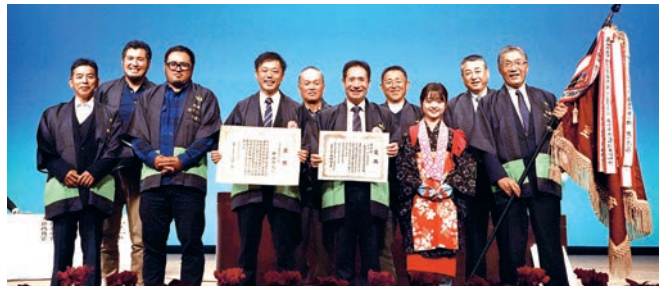
▲ 第73回全国茶品評会 表彰式(愛知県)

むすびに、令和2年は東彼杵町がますます発展する年になりますことと、町民皆様方のご健勝とご多幸、そして更なるご活躍を祈念申し上げ、ごあいさついたします。