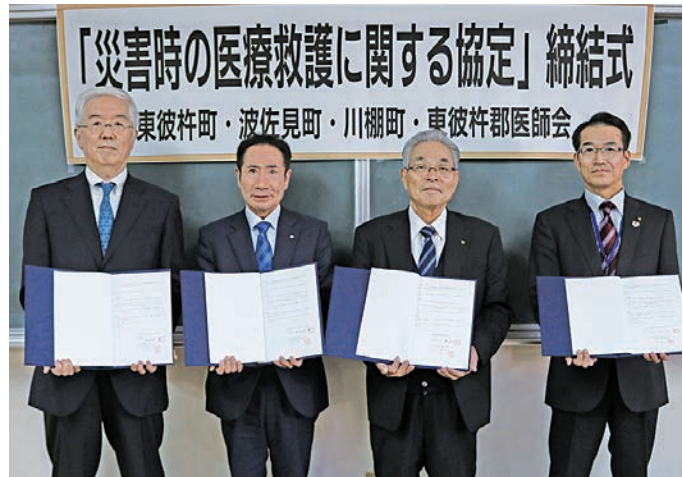
▲ 東彼杵郡医師会の会長と東彼3町の代表

この協定は、大規模災害時に傷病者や被災者が多数発生した場合に、町が開設する医療救護所等において応急措置や医療機関搬送の判断等、医療救護活動の円滑な実施が図られるよう、同会から協力をいただくことで、防災・減災の充実強化を図ることを目的としています。