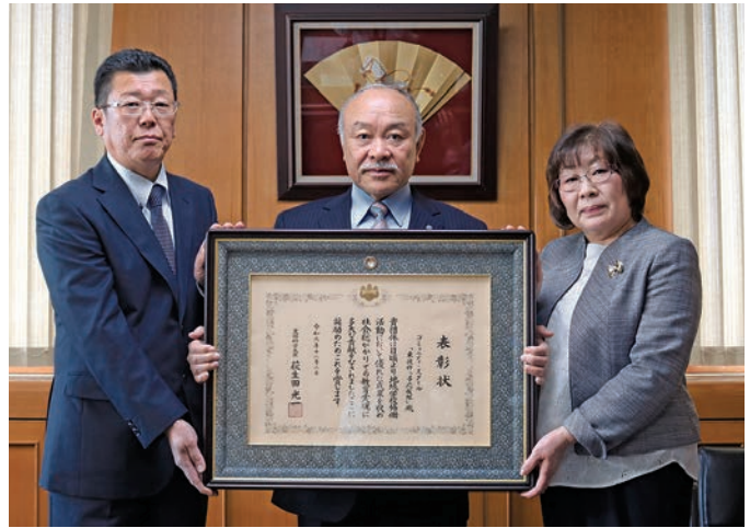
▲ 表彰を受けた「東彼杵っ子応援隊」の方々

各学校運営協議会長の報告では、「人口減少で地域の子どもが減っていく中で一人でも多くの子どもたちに残ってもらうために、地域の魅力などいろいろなものを学校と協力して、教えていきたい。」と伝えられました。