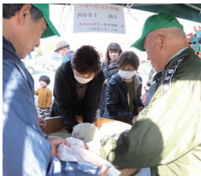
▲ 米すくいコーナー