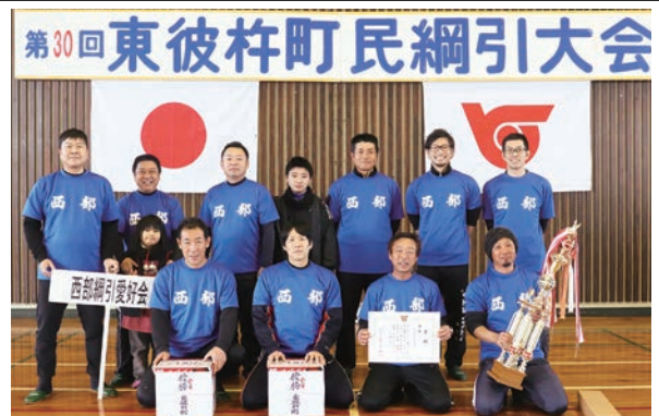
▲ 一般の部 優勝 西部綱引愛好会

フリーの部の優勝は下三根。優勝の感想を一言聞くと、「疲れた!!」と本当に一言返ってきました(笑)。