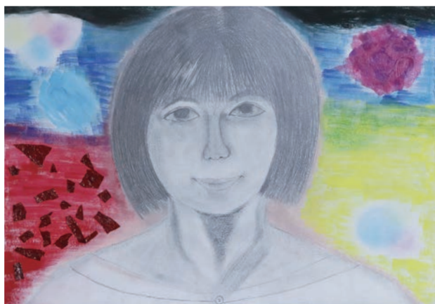
14歳の自分「少しの不安と希望」 背景は心象表現。モダンテクニックなどを用いて、さまざまな自分の気持ちを表現しています。