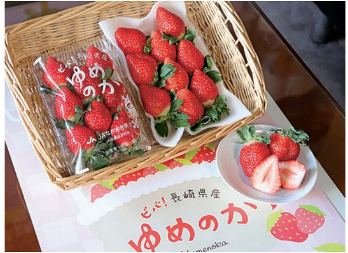
▲ 贈呈されたいちご「ゆめのか」

試食した町長は、「とても美味しい。この味をぜひ全国の方々に知って頂きたいし、これからのPRや省力化についても、できる限りの支援を行っていきたい」とお礼の言葉を述べられました。