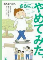
さらに、やめてみた わたなべ ぽん 著