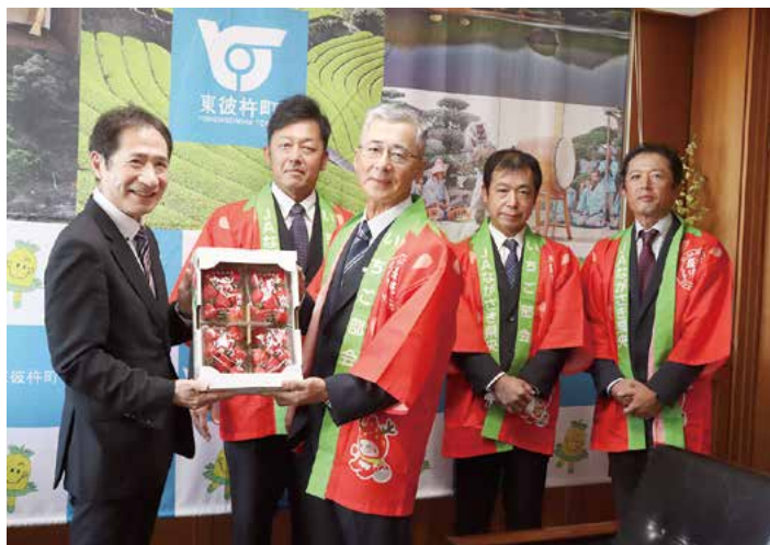
▲ いちごの贈呈の様子

試食した町長は、「とても美味しい。この味を全国の方々に知っていただきたいし、これからのPRや担い手対策についても、できる限りの支援を行っていきたい」とお礼の言葉を述べられました。