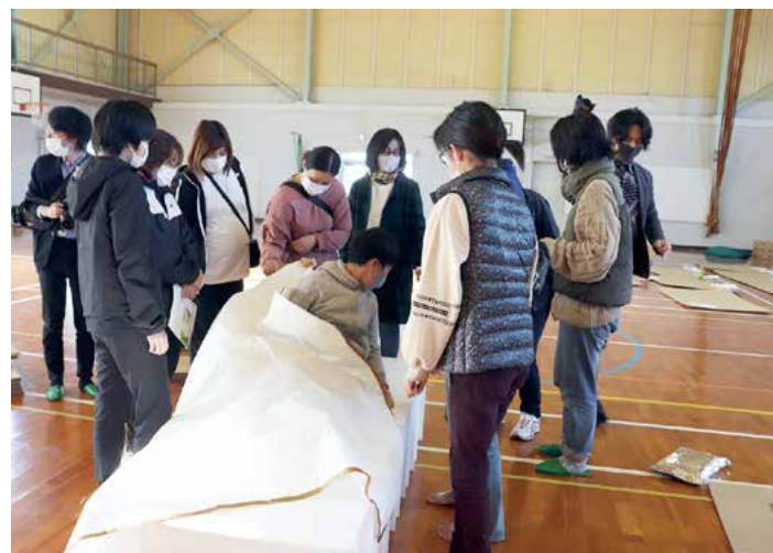
▲ ダンボールベッドに寝てみる子どもたち

保護者の方は、「こういう経験が子どもたちのためになってくれたら。実際の有事の際には子どもたちもできることがあり自信に繋がるのでは。」と話されました。