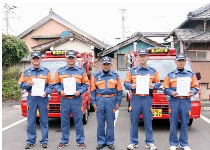
▲ 配備された消防車両と団長、各分団長たち

「消防団を中核とした地域防災力の充実強化に関する法律」に基づき配備したもので、火災に限らず昨今増えてきている災害等への対策として、消防団がこれからも地域に欠くことのできない存在と位置づけ、装備の充実や改善を図っていきます。