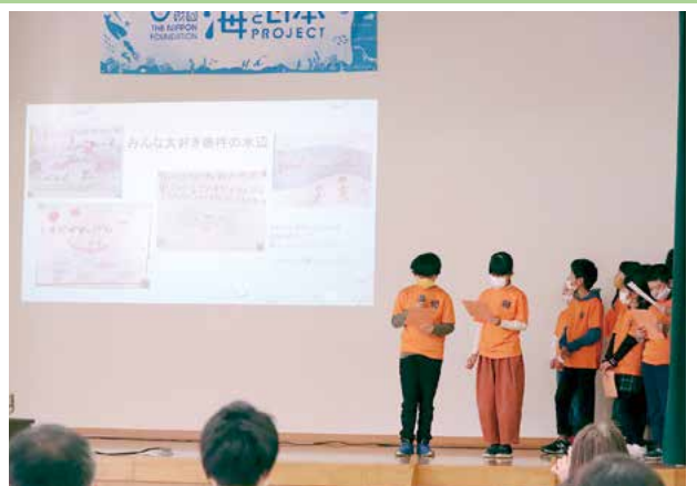
▲ 川について発表している学童の子どもたち

休耕田を利用した活動や、カヌー、歌や清掃活動など、様々な方向からの活動報告に参加者は興味深く耳を傾けられていました。