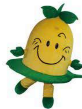
東彼杵町キャラクター お茶の妖精「茶子ちゃん」