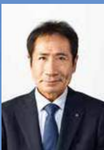
東彼杵町長 岡田伊一郎

本誌では、東彼杵町の自然、歴史文化、特産品、そして町民同士の絆など、貴重な地域資源と魅力を紹介しております。私たちの町・東彼杵町に、より一層の興味と愛着をお持ちいただければ幸いです。